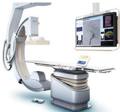
Installato Angiografo Cardiologico fisso, in attesa di collaudo

Prenota il tuo consulto sul sito : www.nelcuoredellatuacittà.it .