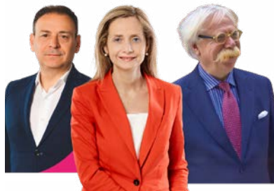
di Francesca Incandela