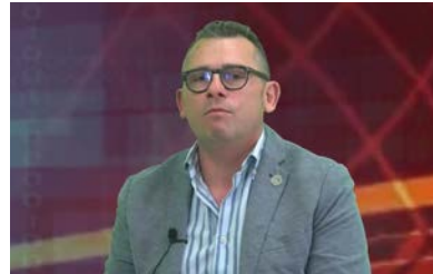
di B. Scaturro