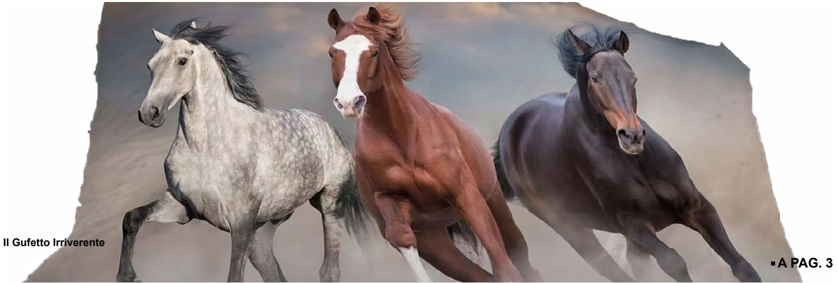
Il Gufetto Irriverente